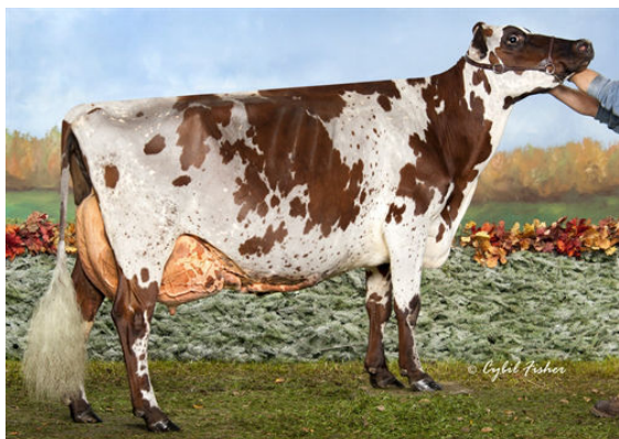
MARGOT PATAGONIE DAM